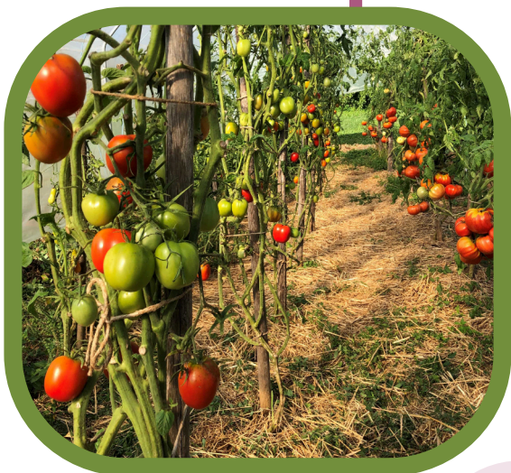
Paradižniki (10. september 2023)

Kadar pride dan, ko nimate volje za sejanje in presajanje rastlin ter za delo na vrtu ali v sadovnjaku, ko je v trgovini, na zabavi, obisku, v menzi pred vami bleščeče privlačna hrana ali pijača in veste, kaj vse je lahko v njej, naredite nekaj zase in za svoje najbližje. Nadaljujte (če še niste, pa začnite) lastno pridelavo zdrave hrane. Dobro prehranjevanje je oblika samospoštovanja.