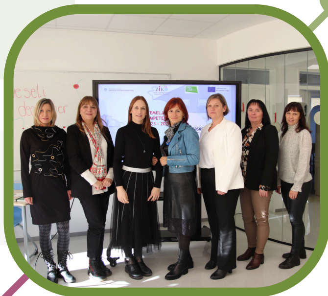
Članice projektne skupine Temeljne kompetence 2023-2029 Pokolpje, december 2023.

Preplet naštetih kompetenc tesno objema skrb za trajnostni način dojemanja sveta in vsakdanjega življenja. Izobraževalci odraslih čutimo privilegij in dolžnost, da prispevamo k vesplošnemu ljudskemu prosvetljevanju o preživitvenem pomenu trajnostnega delovanja na vseh področjih. Predvsem s svojim zgledom, zavzetostjo, vztrajnostjo in navdihom. Kar je uporabno, ne zavračajmo, pa četudi gre za dobrine, ki niso materialne narave. Ustvarjajmo skupnost, v kateri nas bodo povezovale skupne vrednote in se bodo tkale niti dolgoživosti.