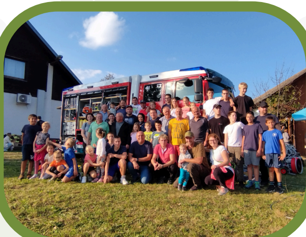
Dan odprtih vrat PGD Stari trg ob Kolpi, 2023.

Ne glede na preteklost, sedanost ali prihodnost je moje delovanje usmerjeno v povezovanje ljudi in narave v našem skupnem okolju. S predanostjo in optimizmom želim soustvarjati prijetno in uspešno prihodnost za vse. Moje povezovalno delo v skupnosti je zgled, da vsak prispevek šteje in da lahko s skupnimi močmi ustvarimo trajnostno in vključujoče okolje za vse.