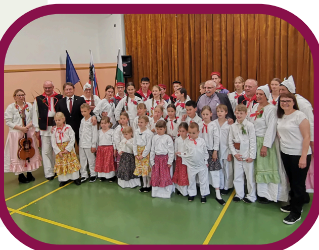
Praznik KS Stari trg ob Kolpi, 2023.

Vesela sem, da sem lahko del tako žive skupnosti in da imam priložnost prispevati za skupno dobro. Verjamem, da sta medsebojno sodelovanje in spoštovanje ključ do uspeha in blaginje vseh prebivalcev. Moje delo ni zgolj odgovornost, temveč privilegij, ki mi omogoča uresničevanje vrednot, ki jih gojimo v naši skupnosti.